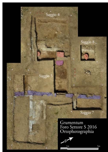
Fig. 2 Ortofoto conclusiva della campagna 2016. La facciata degli edifici orientali è in blu, il colonnato in rosa, e la fondazione di Colonna in viola.

Nel lato orientale del settore è stata confermata la presenza di multiple strutture rettilinee pertinenti a dei possibili edifici con una facciata comune (fig.2, in blu) e che si aprivano su una strada ampia circa 5 metri. Lungo il lato ovest di quest'area stradale sono state identificate due ulteriori strutture connesse