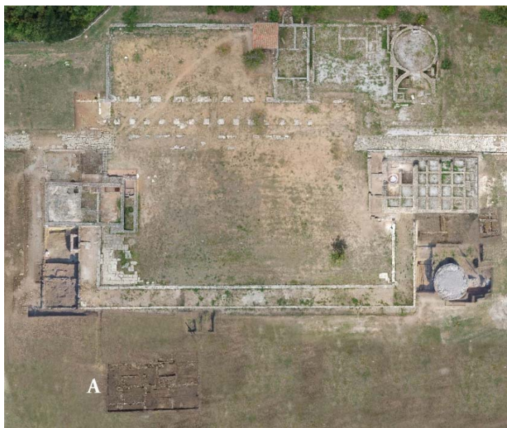
Fig. 1 Lo scavo di Scalfari del 2009 è indicato dalle lettera A.

Queste due stagioni hanno portato una serie di risultati importanti.