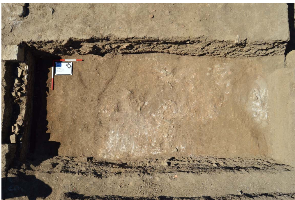
Fig. 6 Resti della pavimentazione di malta e della fondazione per colonna nel saggio 5.

Saggi 7 e 8 sono stati posizionati oltre il limite nord dello scavo 2014-2015 per poter confermare o meno la continuazione del colonnato e della facciata comune. In entrambi i casi si sono raggiunti gli obiettivi sperati: i resti di una colonna di mattoni – conservata ad un livello molto più alto rispetto a quella nel saggio 4 – vennero alla luce poco dopo aver aperto il saggio 8. Nel saggio 7 invece è stata dimostrata la continuazione del muro (US 6264) interpretato come la facciata comune dell'edificio orientale; inoltre un muro ad esso perpendicolare con direzione est è stato rinvenuto vicino al limite sud del saggio (fig. 7).