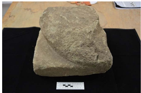
Fig. 4 Base di colonna in arenaria dal saggio 8.