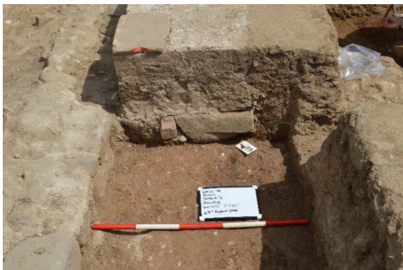
Fig. 3 Base di colonna in arenaria rinvenuta nella fondazione del pilastro nel saggio 4.

Nella zona inferiore del pilastro (US 6266) una porzione di base di colonna in arenaria venne trovata capovolta e riutilizzata come parte della fondazione (fig. 3), e, curiosamente, una base quasi identica è stata recuperata dagli strati superficiali del saggio 8 (fig. 4).