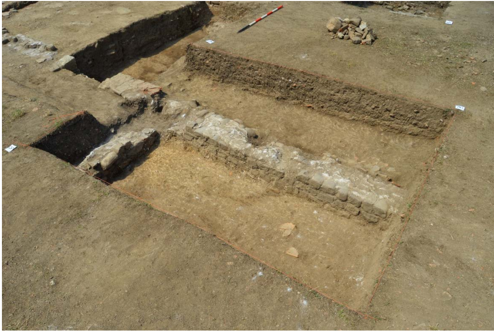
Fig. 7 Saggio 7 alla conclusione della campagna 2016 visto da nordest.

Nonostante le quote raggiunte nei saggi 4 e 5 - i cui livelli inferiori sono più bassi del livello tardo repubblicano del foro (589.20-589.30 s.l.m.) - i materiali diagnostici rinvenuti finora indicano che i nostri strati possono essere datati alla metà del secondo secolo DC. Di conseguenza lo scavo di questi due saggi dovrà proseguire durante la campagna 2017. Ci auguriamo che questa continua esplorazione fornirà delle prove chiare per la funzione dell'area compresa tra la facciata est e il colonnato, funzione che consideriamo ancora non determinata con certezza. Se quest'area fu occupata da una strada quando Grumento divenne colonia romana, allora ci si augura di trovare pavimentazioni stradali comparabili con quelle rinvenute negli scavi del decumano. Se, invece, a questa area corrispondeva un portico, allora un pavimento confacente dovrebbe essere stato steso almeno nella fase iniziale. Nel saggio 7, un robusto programma di scavo a est del muro 6264 potrebbe permetterci di comprendere i tipi di attività che accadevano nell'edificio orientale. Ulteriori scavi a ovest di tale muro aiuteranno a chiarire la natura di questa strada (se di strada si tratta). Il saggio 8 non verrà continuato durante la campagna 2017 dato che ha raggiunto lo scopo di individuare un'ulteriore colonna del colonnato ovest.